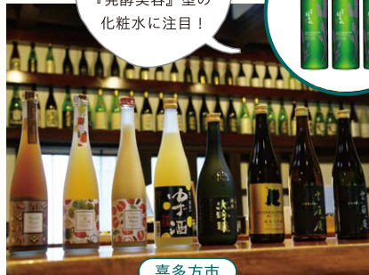
喜多方市 ほまれ酒造

〒喜多方市松山町村松字常盤町 2706 ☎ 0241-22-5151 酒造りを追求し続け100年。会津ほまれの酒造を見学。日本酒に含まれる多くの美肌成分を引き出した化粧水も作っています。