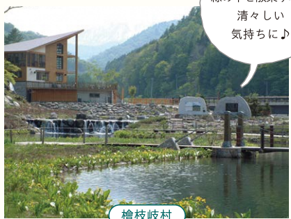
檜枝岐村 ミニ尾瀬公園

〒檜枝岐村左通 124-6 ☎ 0241-75-2065 尾瀬をコンパクトにまとめた植物園。花々が季節ごとに咲き、尾瀬の雰囲気を一足先に味わえるのが魅力です。