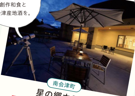
南会津町 星の郷ホテル

〒南会津町界字湯の入 278 ☎ 0241-73-2121 南会津は天体観測に適した全国屈指の場所のひとつ。夏から秋にかけては天の川を肉眼で観測できます。