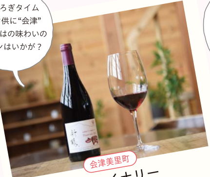
会津美里町 新鶴ワイナリー

〒会津美里町鶴野辺字下長尾 2398 ☎ 0242-23-9899 自然豊かな会津の風土を活かしたブドウ栽培と、味わい深く香り高い親しみやすいワインの醸造を行っています。