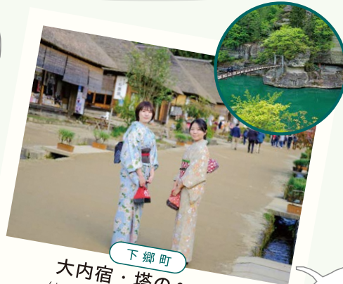
下郷町 大内宿・塔のへつり

〒檜枝岐村左通 124-6 ☎ 0241-75-2065 尾瀬をコンパクトにまとめた植物園。花々が季節ごとに咲き、尾瀬の雰囲気を一足先に味わえるのが魅力です。