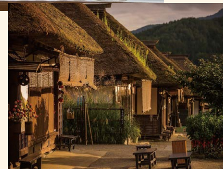
写真上から、霧幻狭の渡し、ほまれ酒造、猪苗代地ビール館、大内宿