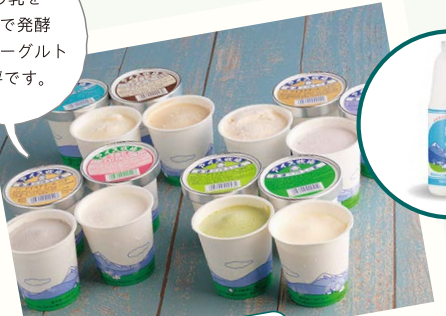
会津坂下町 会津のべこの乳 アイスクリーム牧場

〒会津坂下町金上辰巳 19-1 ☎ 0242-83-2324 アイスクリーム牧場にて生乳のおいしさをソフトクリームとアイスクリームにして販売しています。