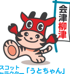
マスコットキャラクター「うとちゃん」