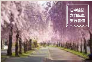
日中線記念自転車歩行者道

1 km 続く緩やかな下り坂。夕日の絶景を見ることが出来る、人気沸騰中の観光スポット。