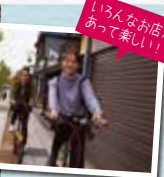
会津といえはここ! 鶴ヶ城もこのエリア