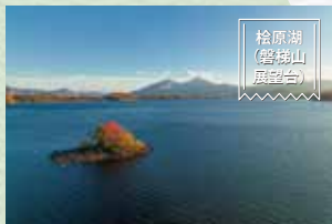
松原湖 (磐梯山展望台)

猪苗代湖の湖岸に沿って東西約 3.4 km のサイクリングロードが走っています。