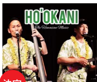
決定 Ho'okani with ひろみフラスクール