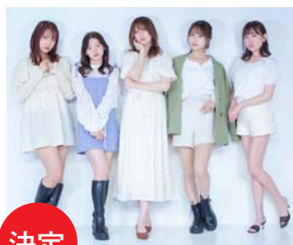
決定 福島美少女図鑑 いつもの5人