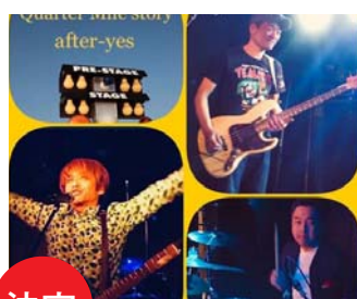
決定 after yes