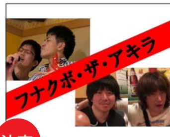
決定 Funakubo The Akira