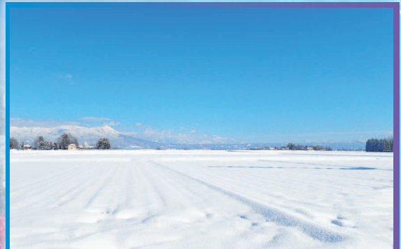
会津坂下町からの景色(会津盆地)

会津坂下町は福島県の西部に位置し、自然豊かな一方で、町の中心にはスーパー・コンビニ・病院など数多くある、ちょっと便利な田舎町です。