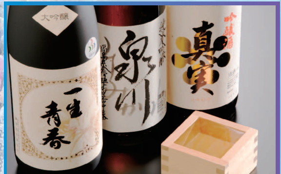
町内3つの酒蔵 廣木酒造・豊国酒造・曙酒造の飲み比べ体験